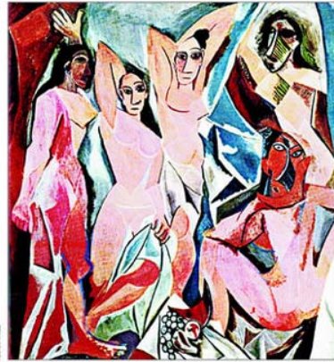
PABLO PICASSO.— El cubismo surge en la conjunción de Júpiter, Sagitario y Urano, según Gonzalo Pérez.

con la revolución creativa. 2006 todavía es un año incierto. El año que comienza se proyecta fascinante. Hasta ahora había una cuadratura que trancaba lo social y lo político. En 2007 pasa a primar una relación armónica. Júpiter y Saturno, que estaban en cuadratura, entran a un trino a mediados del 2007".